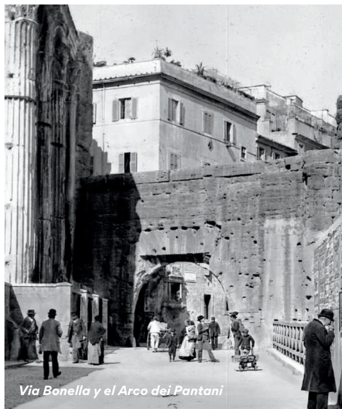
Via Bonella y el Arco dei Pantani