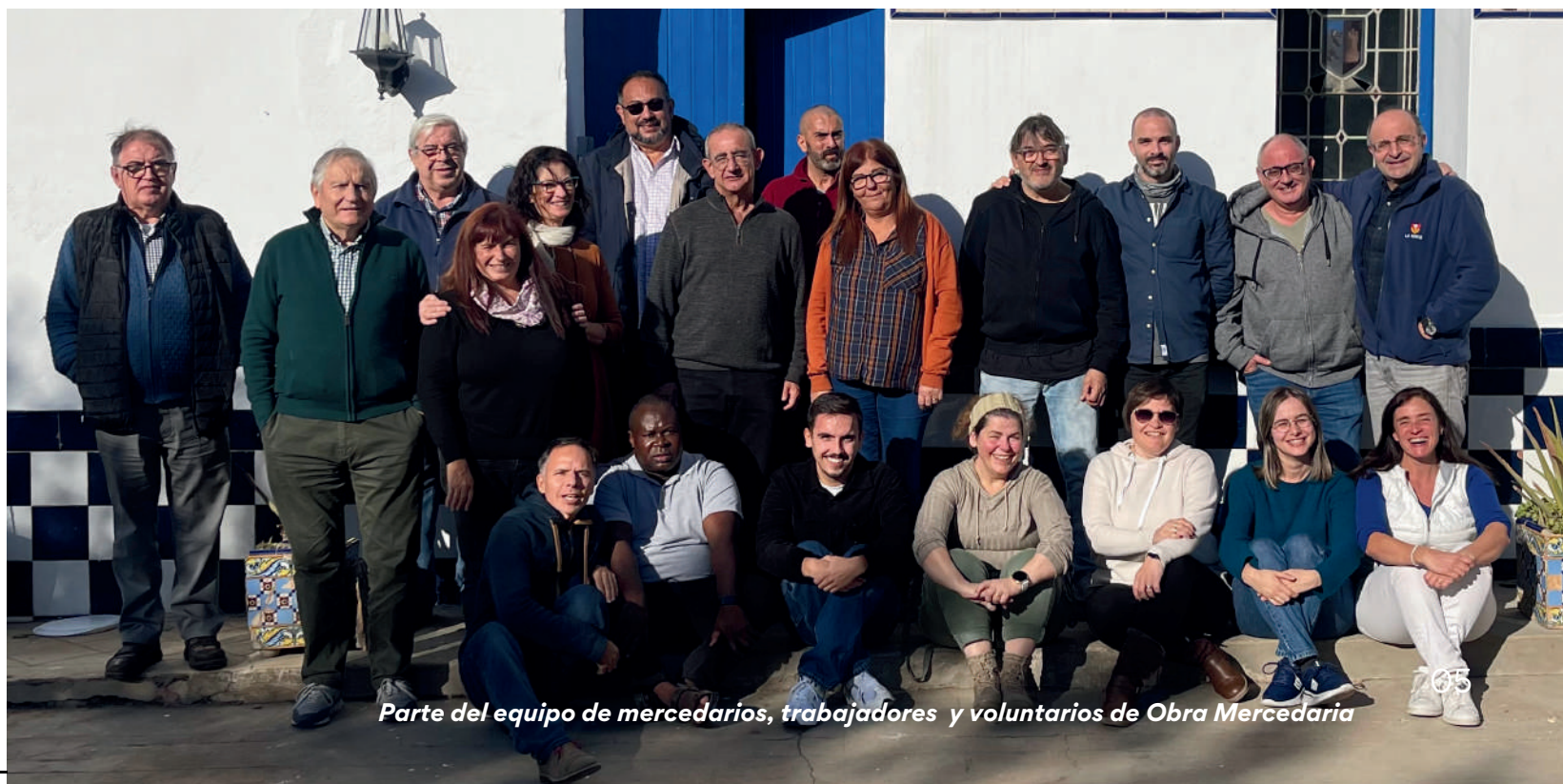
Parte del equipo de mercedarios, trabajadores y voluntarios de Obra Mercedaria

Durante este curso hemos llevado a cabo diferentes actos con una doble finalidad: la primera, para que cada día sean más las personas que conozca a la Mare de Déu de la Mercè y su carisma, y la segunda, para recaudar fondos para que podamos seguir trabajando en esta obra social donde acompañamos a las personas privadas de libertad.