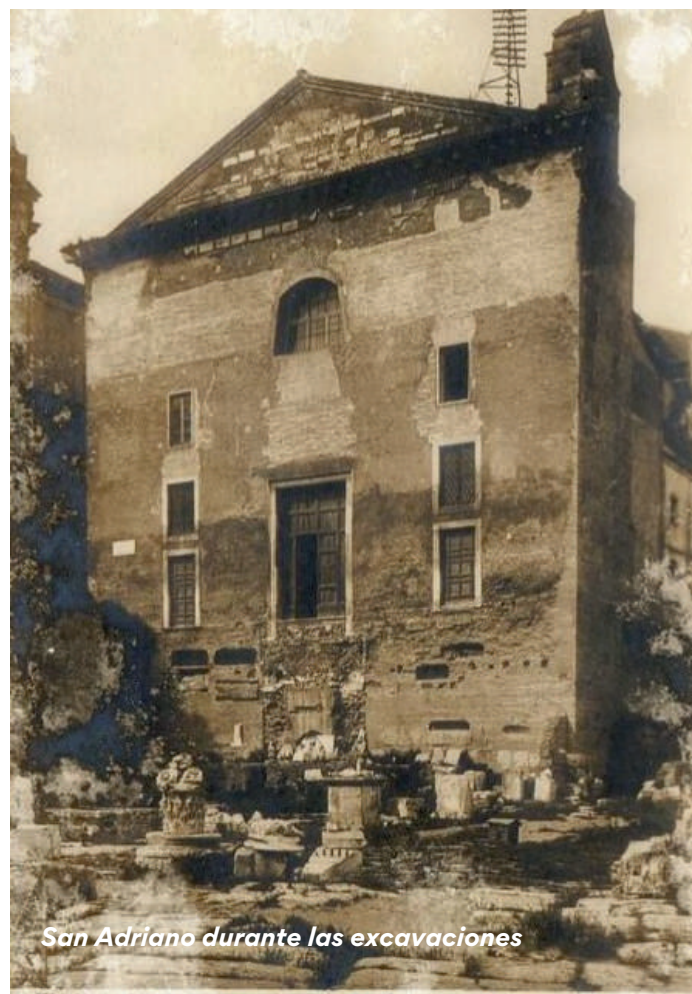
San Adriano durante las excavaciones

En 1585, el cardenal Carlo Michele Bonelli “Alessandrino” (sobrino del Papa San Pío V) compró el palacio Buoncompagni, cerca de la columna de Trajano. Por ello decidió reurbanizar el barrio vecino, conocido como el Pantani. Se crearon dos calles que con su nombre homenajeaban al promotor: Via Alessandrina y Via Bonella. En la segunda, se hallaba además un arco conocido como “dei Pantani” que, según parece, era en origen parte de los mercados de Trajano.