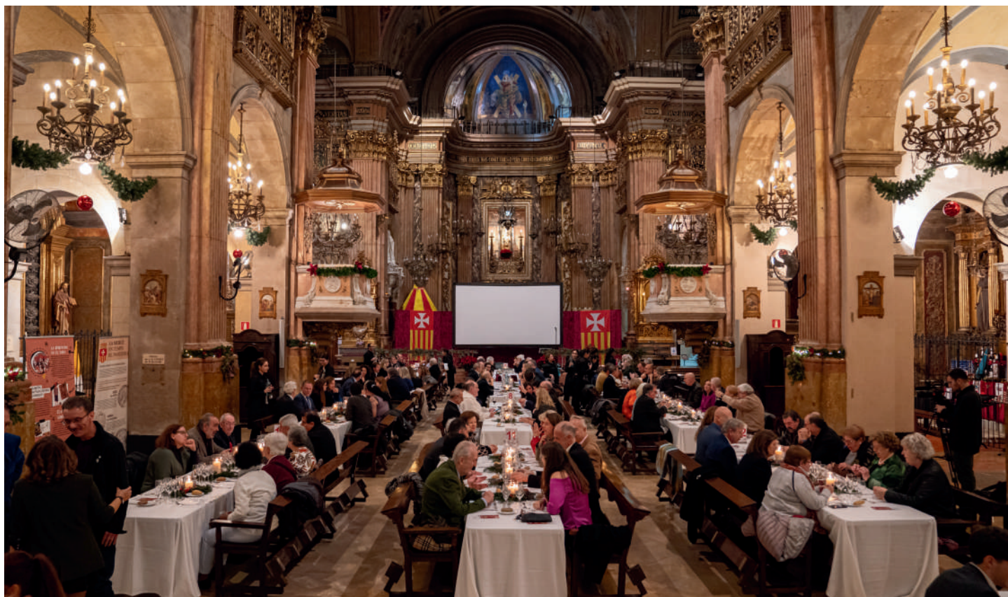
Cena de Navidad en la Basílica de la Merced de Barcelona en beneficio de la Fundación Obra Mercedaria