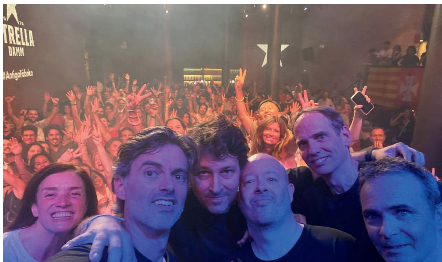
Concierto solidario de "The Colash" en la antigua fábrica Damm en beneficio de la Fundación